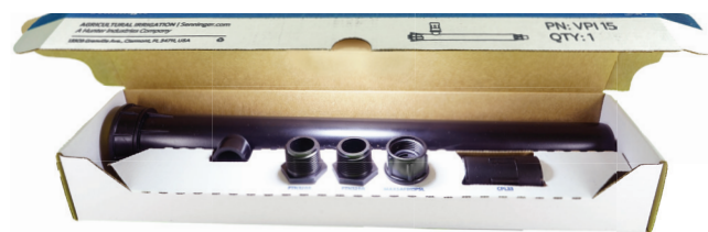
Mostrado acima: Componentes por caixa.